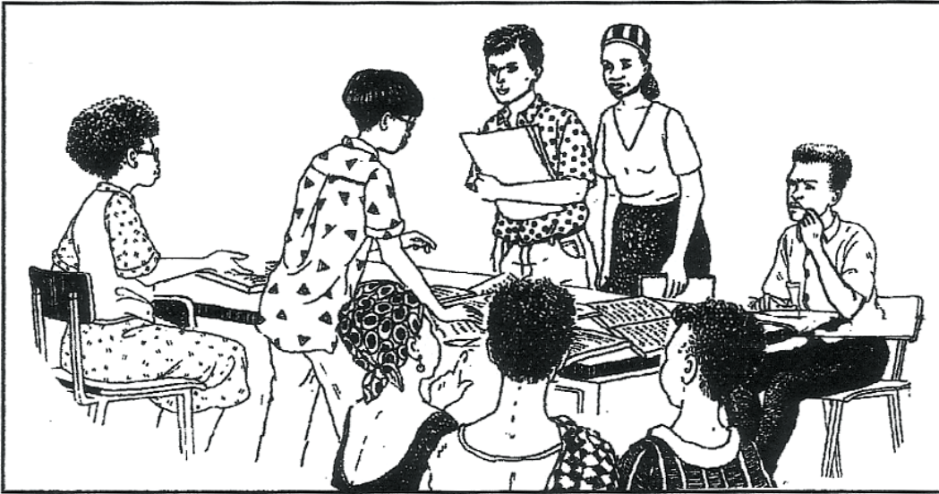
وضع خطة لإيجاد المال